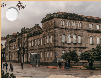
Instituto Valle Inclán