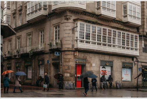
Praza da Peregrina, edificio do antigo Café Méndez Núñez