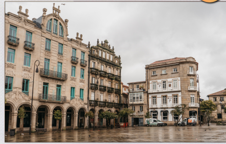
Praza da Ferrería