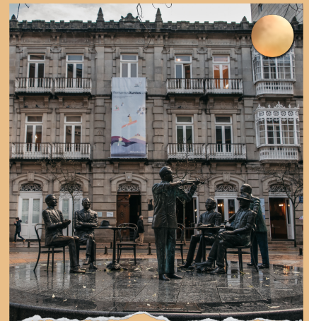
Praza de San Xosé