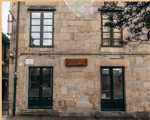
Imprenta Peón, na Praza do Teucro