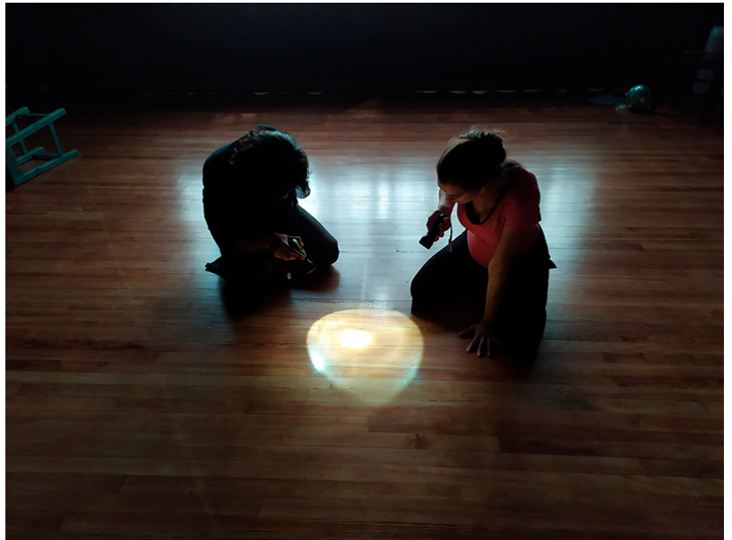
La gala de Inspiraciencia contó con un espectáculo teatral de la compañía Ze Onda

El proyecto cuenta con la con la colaboración de la Fundación Española para la Ciencia y la Tecnología (FECYT) del Ministerio de Ciencia, Innovación y Universidades y la colaboración especial de numerosas