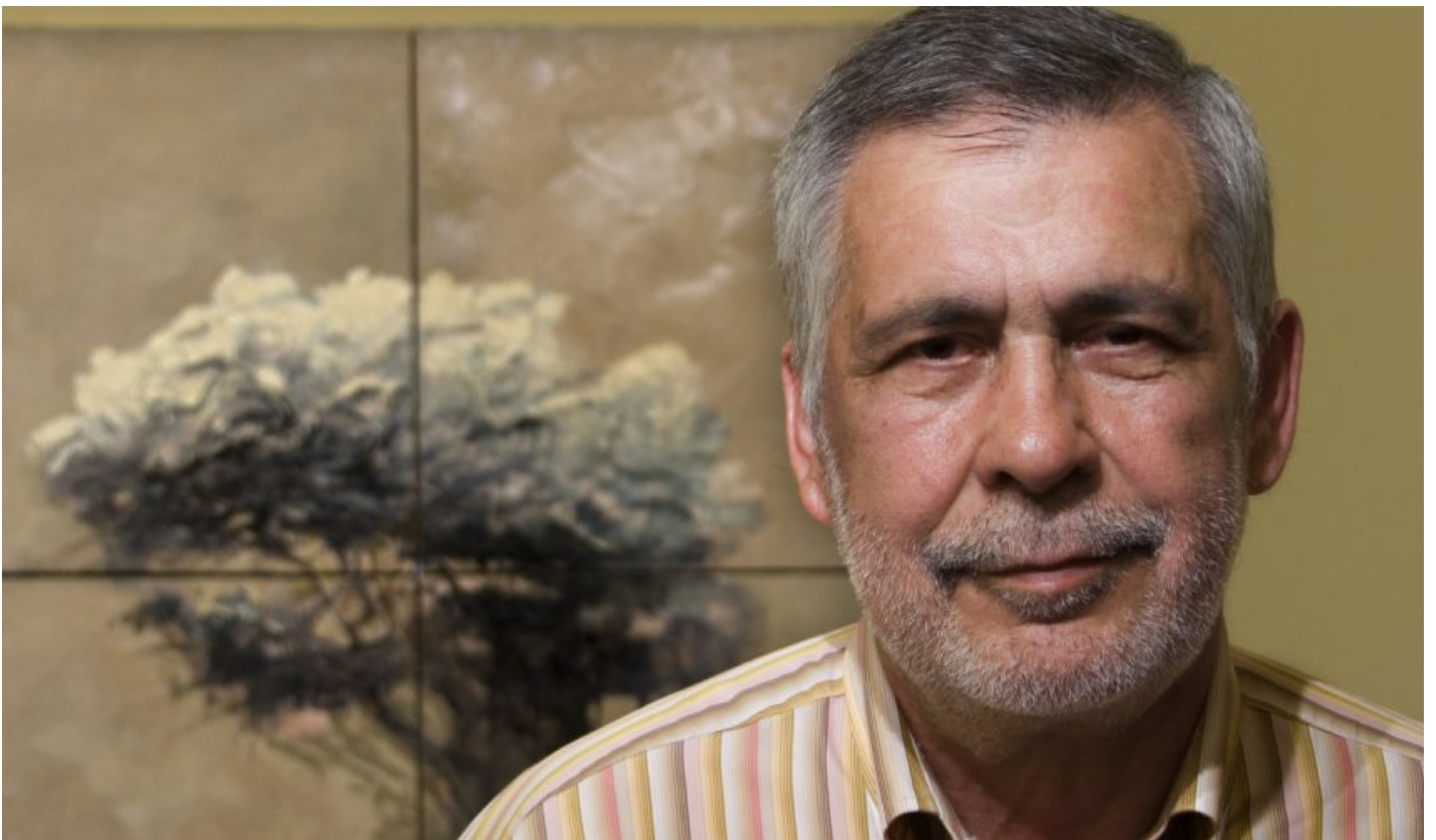
Xabier P. Docampo © DNL

En xuño do pasado ano finou Xabier P. Docampo , unha morte que foi chorada por toda a cultura galega . Escritor, mestre, activista en prol da lingua ou da renovación pedagóxica, grande afeccionado ao cinema e cun talento notable para a narración oral, Xabier Docampo traballou en moitos ámbitos e en todos deixou infindas amizades. Todos eses amigos e amigas estarán presentes no acto de homenaxe, Na voz da amizade , que o vindeiro 29 de maio terá lugar no Teatro Rosalía da Coruña.