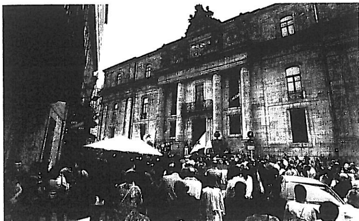
Unha das paradas diante da Facultade de Historia.