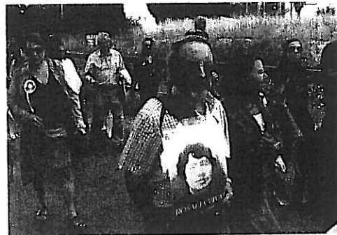
Marchando dende Adina até a estación de Padrón.

Quen mellor que Rosalía para non nos perder polo camiño?