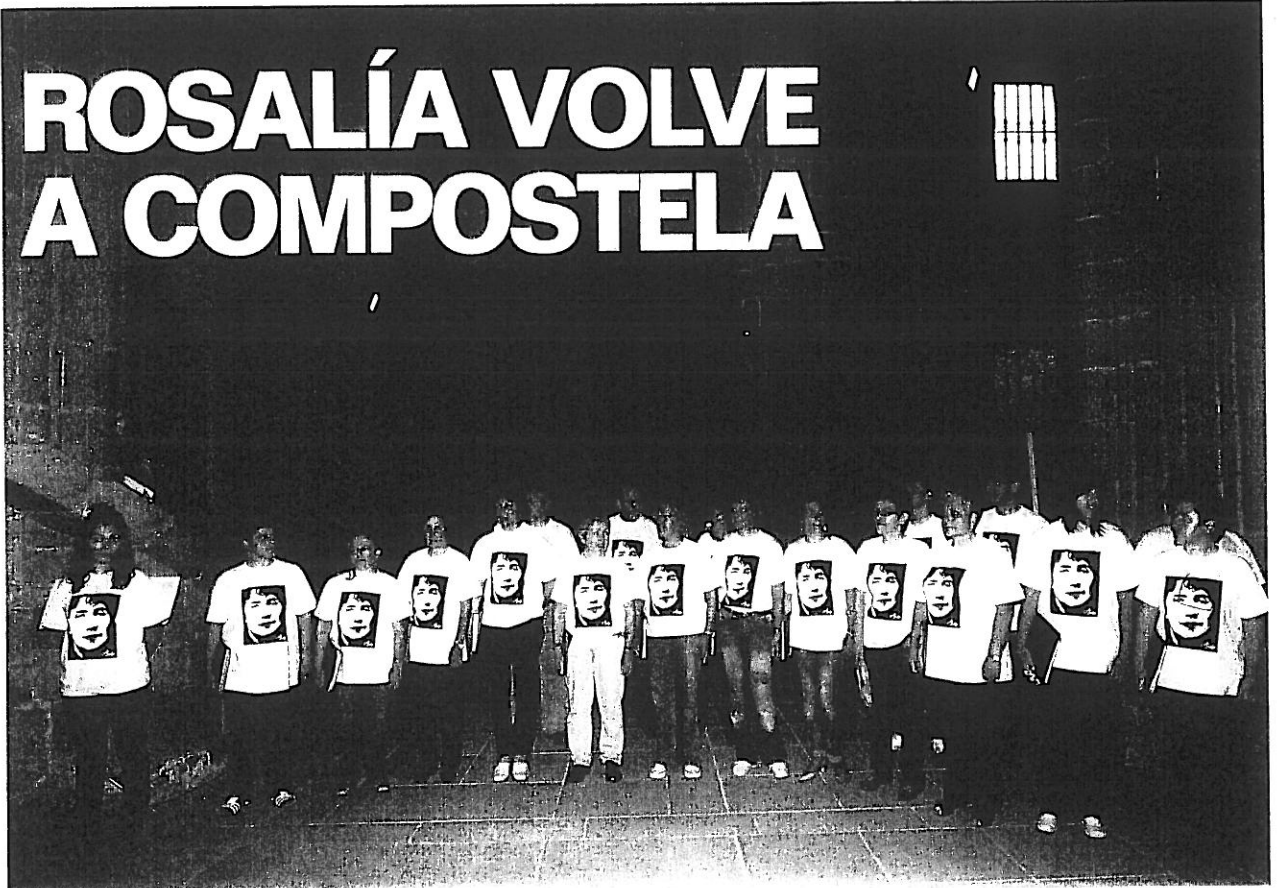
O Coro da Asociación Musical Solía interpretou o Angelus de Massenet no Panteón de Galegos Ilustres.

Varios miles de persoas reivindicaron a escritora no 125 aniversario da súa morte nun acto no que se reclamou a laicidade do Panteón de Galegos Ilustres