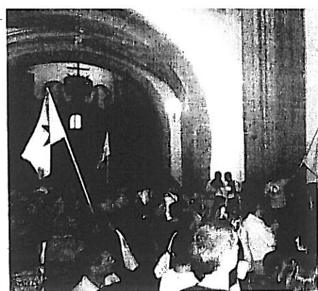
O Himno Galego puxo o ramo á xornada diante da tumba de Rosalía de Castro.