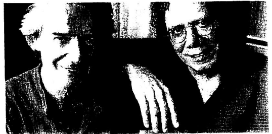
John McLaughlin y Chick Corea

Con Chick Corea y John McLaughlin estarán Kenny Garrett al saxo, Christian McBride al bajo y Vinnie Colaiuta a la batería.