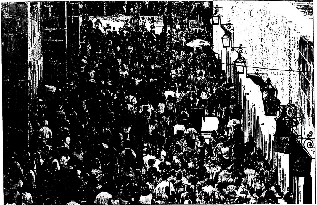
Miles de cubanos pasearon durante quince días polo recinto de La Cabaña, sede da Feira do Libro da Habana

Na feira, Galicia recibiu o premio á mellor caseta internacional, e, ademais, como puntualizou o Bugallo, asináronse acordos institucionais co Instituto de Literatura e Lingua de Cuba; a Escola Internacional de Cine de Cuba; o Instituto Superior de Arte (ISA); e o Museo Nacional de Belas Artes. Ademais, houbo colaboracións de artistas galegos e cubanos nos proxectos ‘Descarga ao vivo’ (música) e ‘Ópticas cruzadas’ (cine). Segundo a conselleira, hai “un