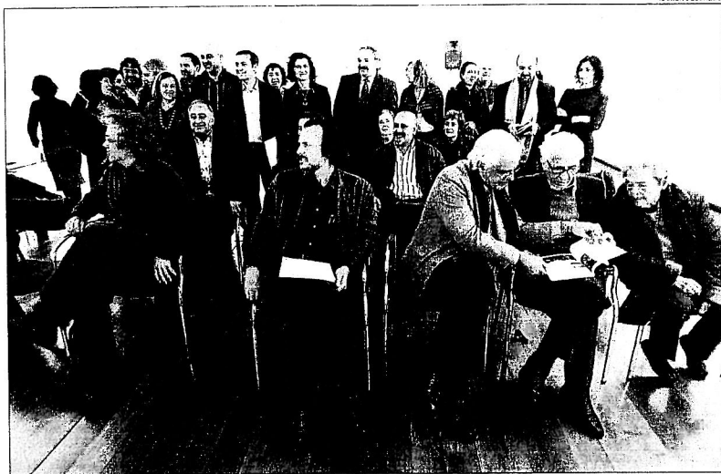
Algúns integrantes da embaixada estiveron onte facendo tamén un balance da feira