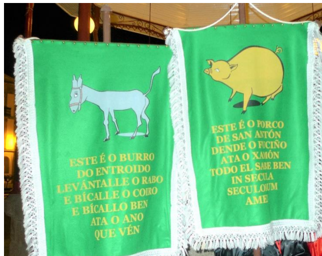
FOTO 20. ESTANDARTES DO BURRO E O PORCO. ENTERRO DA SARDIÑA (LUGO)