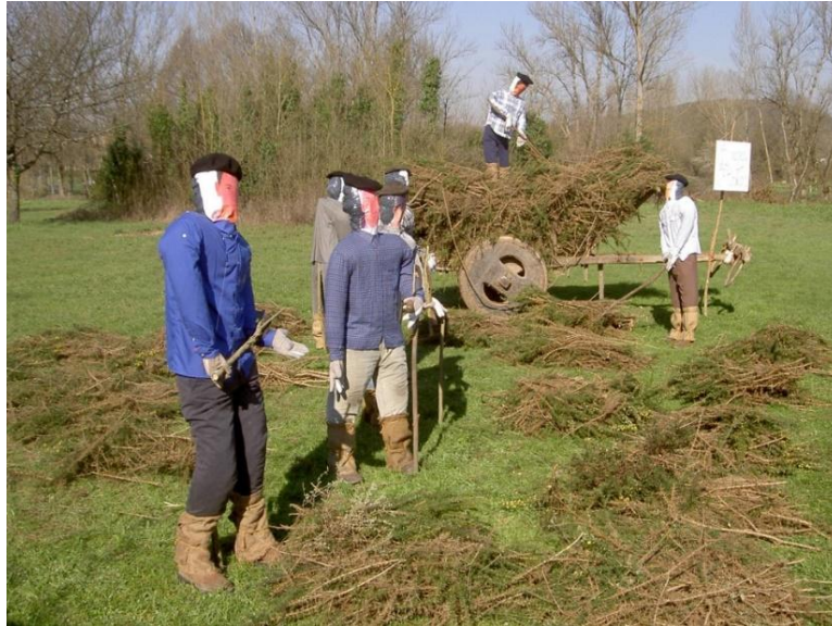
FOTO 12. XOVES DE COMPADRES. A ROXA DOS TOXOS. DISTRIZ (MONFORTE DE LEMOS)