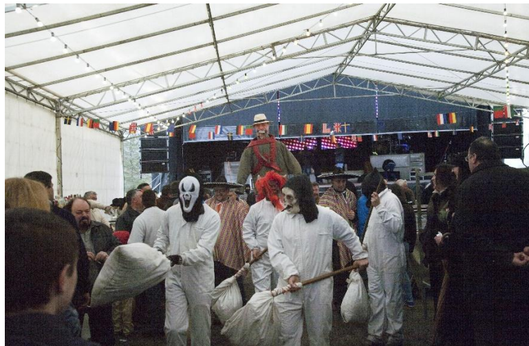
FOTO 11. A MASCARADA DOS FARELEIROS (VAL DE FRANCO) (CASTRO DE REI)