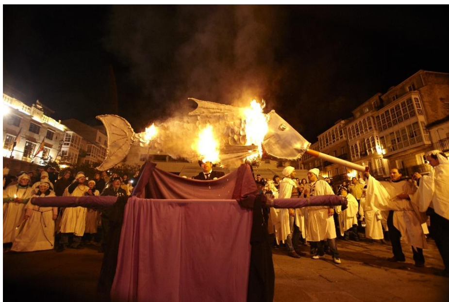
FOTO 7. QUEIMA DA SARDIÑA EN VIVEIRO

5. VOSTEDE TEN ESTUDADO DIVERSAS MANIFESTACIÓNS DO ENTROIDO NA PROVINCIA DE LUGO. QUE ASPECTOS DESTACARÍA DENTRO DELAS, TANTO NO ASPECTO DAS MÁSCARAS COMO DOS RITUAIS, FRONTE A OUTRAS DOUTROS PUNTOS DE GALICIA OU DOUTROS LUGARES?