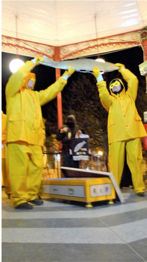
FOTO 19. A SARDIÑA É PRESENTADA AO PÚBLICO DA CIDADE DE LUGO.