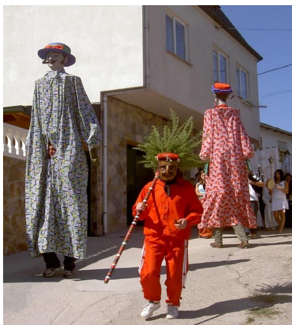
FOTO 4. O MECO VAI ACOMPANHADO DAS PAMPÓNIGAS NA PROCESIÓN DOS REMEDIOS (A ERMIDA) (QUIROGA).