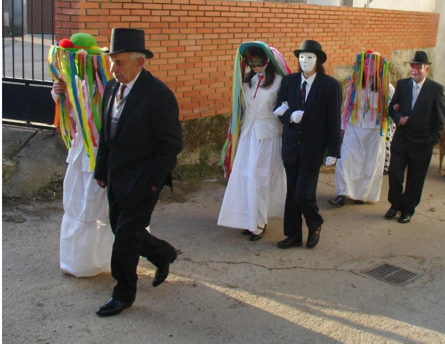
FOTO 18. AS MADAMAS E OS DANZARÍNS DE SALCEDO (A POBRA DE BROLLÓN)