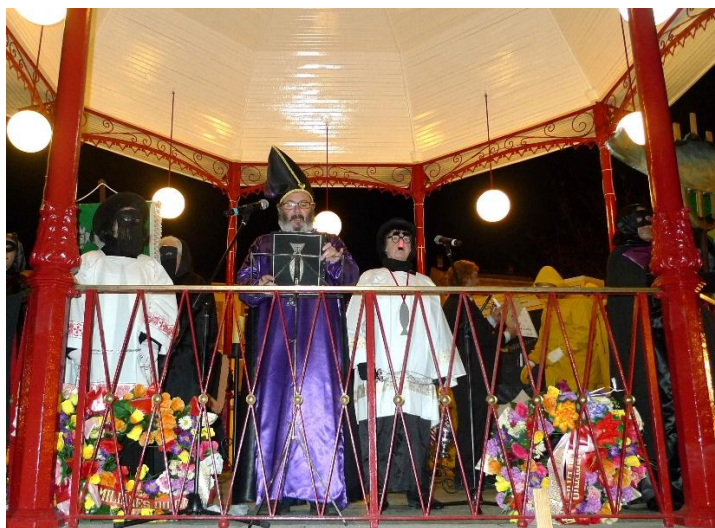
FOTO 2. ENTERRO DA SARDIÑA (LUGO). O GRAN ESPETÓN RECITA OS FERRETES.