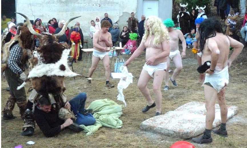
FOTO 16. A RUPTURA DUN OFICIO (SANTIAGO DE ARRIBA). (CHANTADA) “A GUARDERÍA DO MOREDO”.