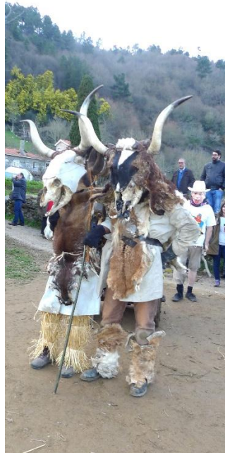
FOTO 14. A MASCARADA DOS MARAGATOS OU PELIQUEIROS (SANTIAGO DE ARRIBA)

persoa se achegue á fogueira. A carauta dos fareleiros, amosa moitas veces un carácter animal, representando a un mono; tamén, a un oso, como ocorreu no ano 2025.