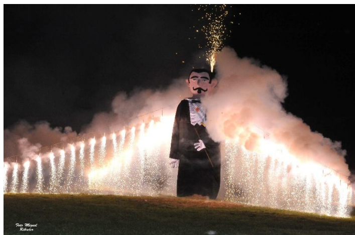
FOTO 1 . A QUEIMA DO MECO. RIBADEO.

O Entroido no ámbito lucense mantén o seu enraizamento debido a que as súas expresións ritualísticas seguen transmitíndose por tradición oral de país a mozos, facendo posible que esta festividade siga conservándose na actualidade. Constitúe unha expresión colectiva de identidade das diferentes comunidades nas que aínda se conmemora. Este evento profano adquire un gran significado nalgúns lugares ata o punto de acadar máis relevancia que calquera outro evento relixioso. Non obstante, hoxe á precariedade demográfica existente en moitas comunidades motiva que algúns membros das mesmas estean dando a coñecer a súa tradición entroideira de primeira man e, polo tanto, dun xeito obxectivo nos Centros de Ensino primario e secundario. Ademais, cómpre que as diferentes Asociacións culturais das parroquias leven a cabo nos seus centros de reunión “obradoiros” de aprendizaxe dos diferentes rituais entroideiros mais sempre axeitados a diferentes niveis de idade.