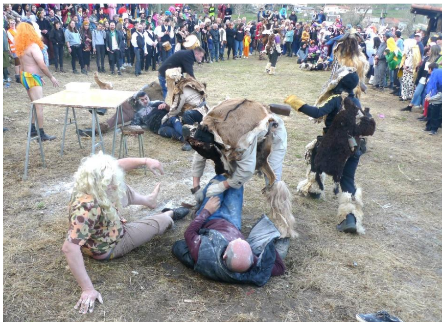
FOTO 17. A RUPTURA DUN OFICIO (SANTIAGO DE ARRIBA). “PON A CARA, CARALLO, PON”.