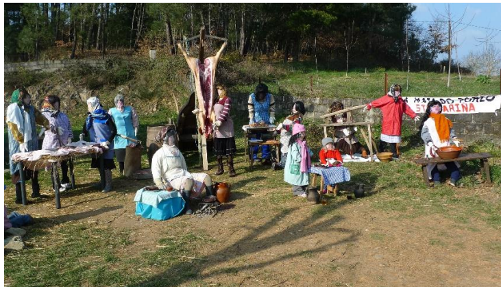
FOTO 9. XOVES DE COMADRES. A MATANZA DO PORCO. SANTA MARIÑA (MONFORTE DE LEMOS)