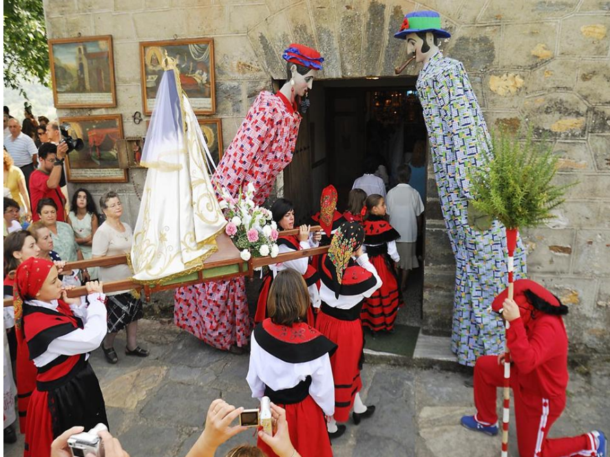
FOTO 5. O MECO E AS PAMPÓNIGAS FACENDO UNHA REVERENCIA AO PASO DA VIRXE DOS REMEDIOS (A ERMIDA)(QUIROGA)