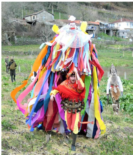
FOTO 3. O “PUCHO” É A PARTE SUPERIOR QUE LEVA “A MÁSCARA DO VOLANTE”.