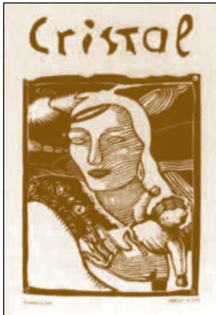
Portada da revista Cristal .