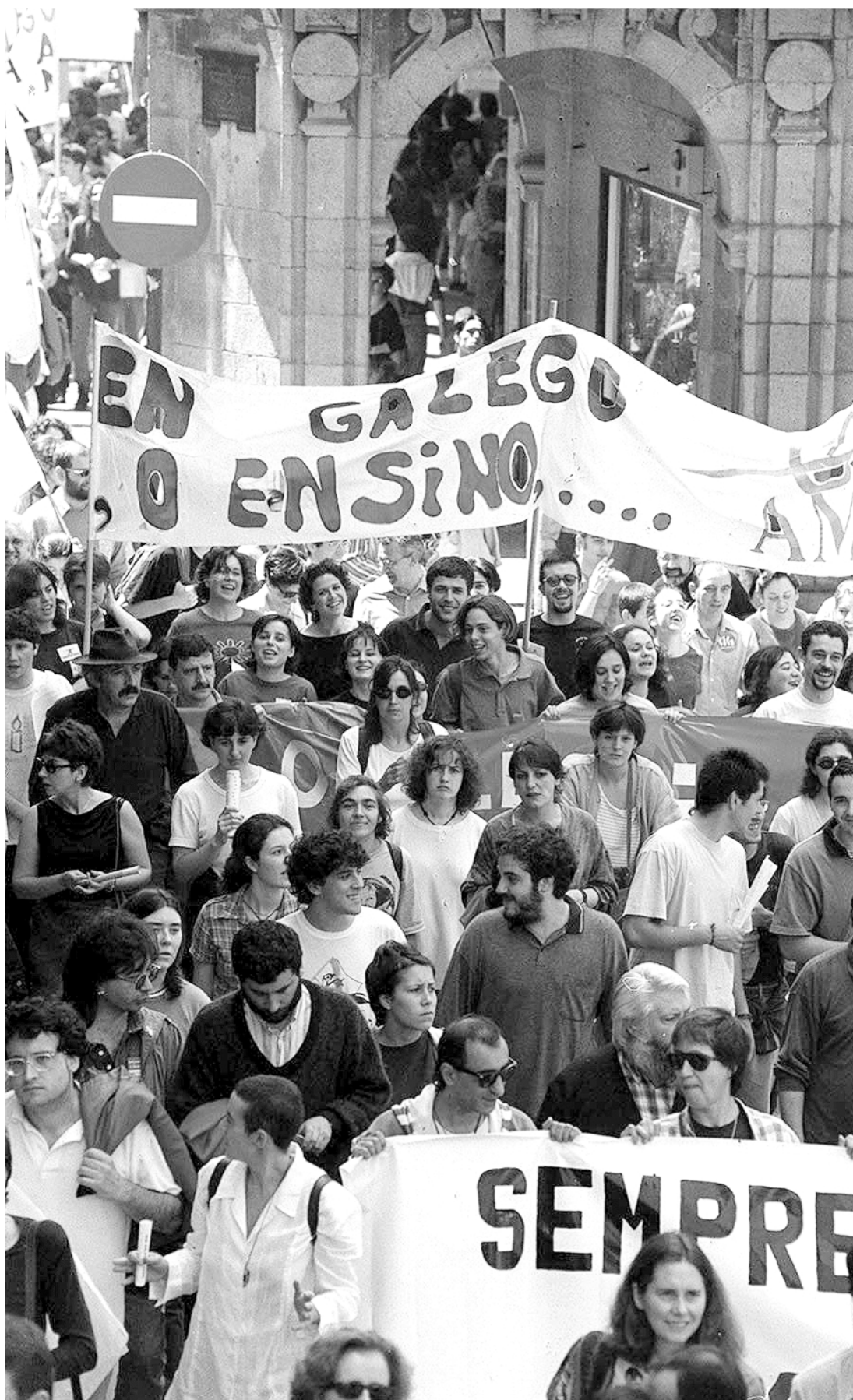
Manifestación pola lingua con ocasión do Día das Letras do ano 1998. Na páxina 5 e na imaxe da dereita, ofrenda en homenaxe a Francisca Herrera no 1987 nun acto presidido polo daquela presidente da RAG, García Sabell (na foto co alcalde da Coruña, Francisco Vázquez. Á esquerda, o académico Alonso Montero na lectura do discurso na sesión plenaria da RAG en homenaxe a Frei Martín Sarmiento no 2002. Na imaxe da páxina 6 corresponde a Xaquín Lorenzo 'Xocas' a quen se lle adicou este ano o 17 de maio. Na 7, unha marcha en defensa da lingua na Coruña no ano 1991