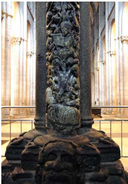
Pórtico da Gloria