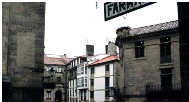
Praza de Salvador de Parga

Neste punto do percorrido, internándonos na cidade histórica, habería algo que dicir de cada rúa, case de cada predio. Non sendo posíbel, o itinerario proposto é un de moitos e a viaxeira, o viaxeiro pode descubrir outros camiños por Compostela.