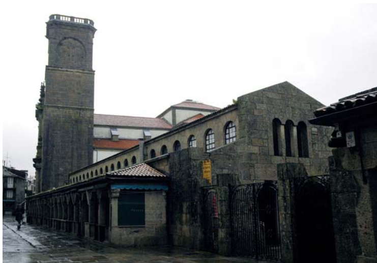
Mercado de Abastos

O mercado de abastos, que cómpre visitar á mañá pois á tarde está fechado, é o segundo lugar da cidade en número de visitas, só detrás da catedral. O máis interesante do mercado non é tanto a construción, de metade do século XX, senón a incesante actividade de quen nel traballan, a variedade de produtos ofrecidos, moitos deles procedentes de pequenas hortas e leiras arredor da cidade. O