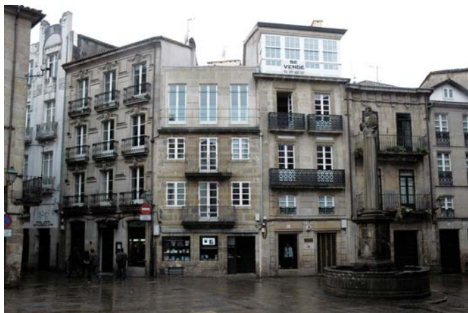
Praza de Cervantes

prensa, estudantes que bulen polas rúas, baiucas onde tomar un viño ou escoitar música. Cómpre dicir que isto non é froito do azar, senón que vén sendo favorecido polo planeamento urbano nas últimas décadas.