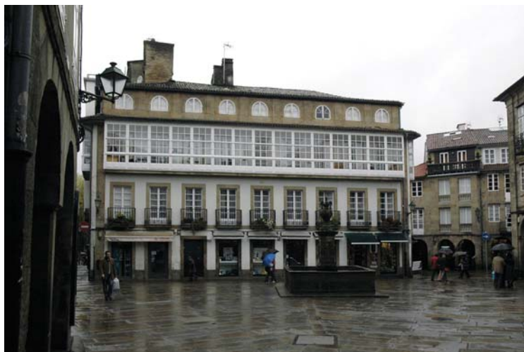
Praza do Toural

en Santa Susana celebrábase unha importante feira de gando todos os xoves do ano, até finais do século XX no que foi trasladada a Salgueiriños.