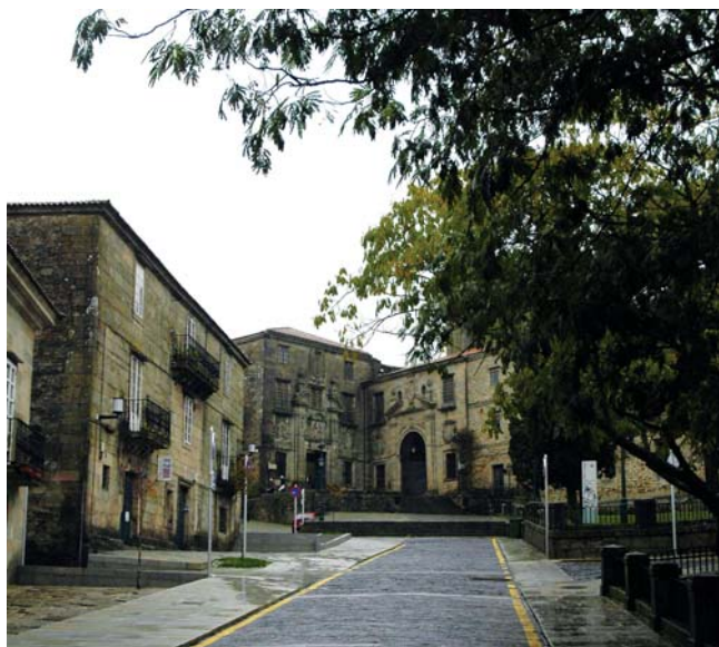
Rúa de Bonaval

da Rocha Forte e pasar a coitelo aos rebeldes, entrou vitorioso na cidade, tomou vinganza e o ferreiro foi preso baixo a acusación de dar morte a un familiar do arcebispo. No século XIV pouca defensa había fronte os poderosos, e Xoán Tuorum foi condenado á forca. Conta a lenda que, camiño dela, pasando por diante da imaxe da Virxe, invocouna