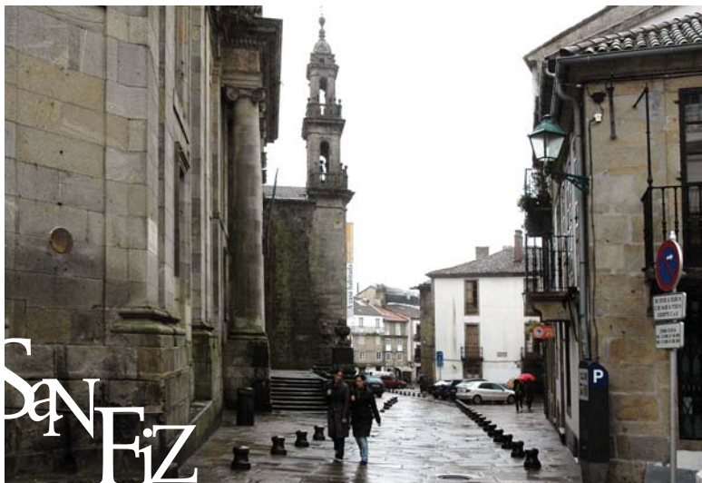
Praza da Universidade

Desde Mazarelos, pola praza da Universidade e a travesa da Universidade, chégase a San Fiz de Solovio e ao mercado de abastos. San Fiz, nun emprazamento anterior ao da propia catedral, é unha das igrexas máis antigas da cidade e nela admiramos o tímpano de estilo románico (malia estar realizado no século XIV), unha adoración dos magos na que é visíbel a policromía que fai por exemplo que Baltasar teña a cor negra que lle corresponde segundo a tradición.