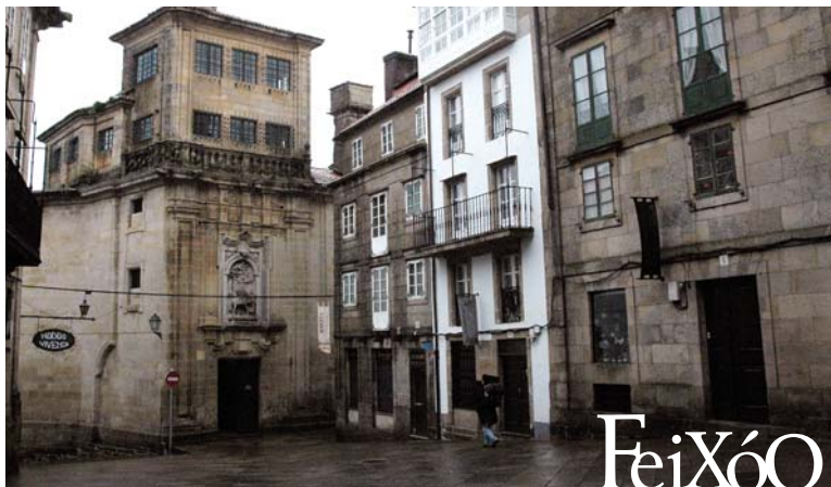
Praza de Feixóo

Desde a praza de Feixóo baixamos en dirección á catedral pola encosta rúa que leva o nome de Xelmírez, antes chamada Rego de