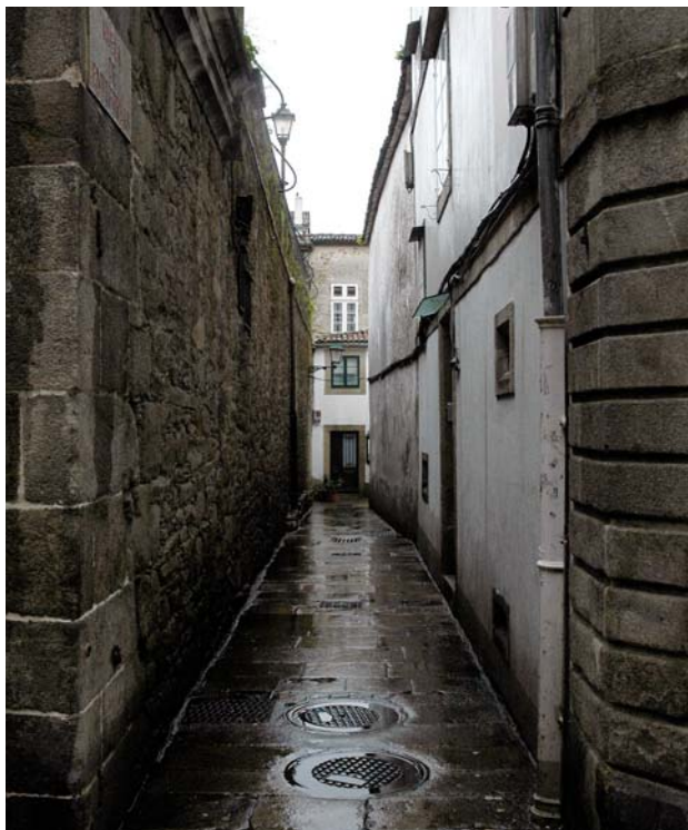
Entrerrúas (comunica a Rúa Nova coa do Vilar)

nun funil coa intención de impedirnos o paso. Camiñando pola ruela da Oliveira en dirección á rúa Travesa encóntrase á esquerda Salsepodes, unha ruela cega da que o nome explica todo. Hai en Santiago rúas máis estreitas que a ruela da Oliveira? Se algunha