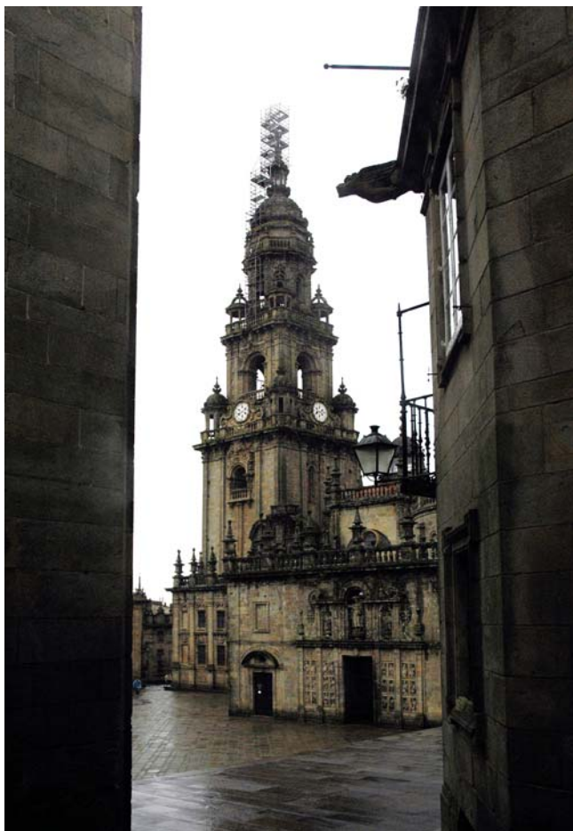
Torre do Reloxo. Tamén chamada a Berenguela