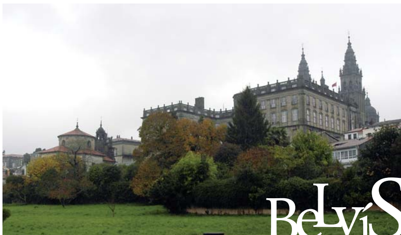
Miradoiro de Belvís

ou as brañas do Sar. Estas poucas, pois a meirande parte das leiras foron asolagadas baixo o cemento e con elas os seus nomes: Agra das Pedras, Lomba da Agra, Cortiña do Pozo, Leira da Lebre, Agro da Espiñeira, Labazal, Tallo da Agra, Labradío das Moas, Eira da Palleira, Leiroas, e até cento e cincuenta e catro só nunha pequena área da Choupana. Centos ou miles máis no conxunto da cidade. Non cabe laiarse por cambios inevitábeis, ninguén volverá sementar liño nunha cortiña e hai