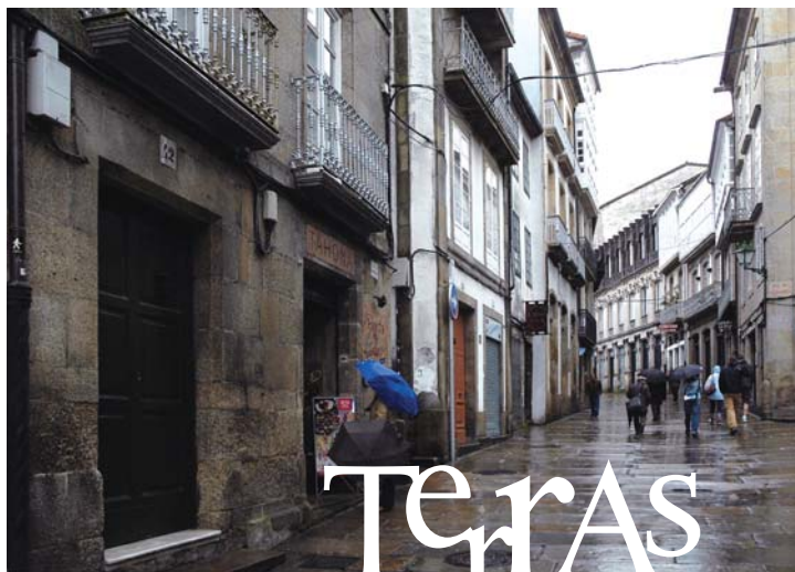
Porta do Camiño

contada. A de Compostela é unha fermosa narración que é posíbel escoitar con só atender o que di cada pedra. Para guiarnos a través do territorio inventado de Compostela, seguindo a traxectoria leste-oeste que parece seguir o sol: quen mellor que o inventor e arquitecto Domingo de Andrade?