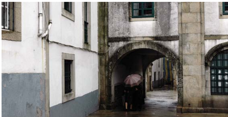
Arco que comunica coa ruela de Oliveira

O mercado foi construído sobre o que foran a finca e as hortas dos condes de Altamira. Por outra banda, en 2005 co gallo das escavacións para amplialo, foron encontrados vestixios arqueolóxicos e partes duns esqueletos baixo a porta sur, que puideron corresponder a unha necrópole. En Santiago todas as pedras teñen algunha historia que contar e, agochadas baixo elas agardan a súa oportunidade centos de historias máis.