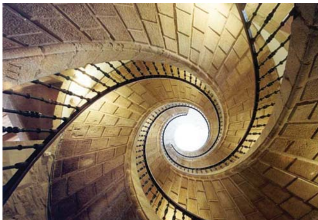
Tripla escaleira de caracol de Bonaval