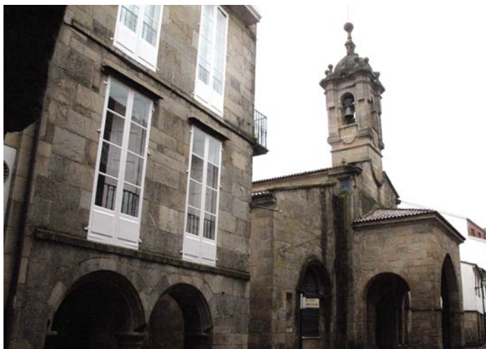
Igrexa de Salomé

Virxe embarazada da portada e por un anxo barroco con lentes que hai no seu interior. Este anxo curto de vista, que debía ser un rato de biblioteca, resúltame máis próximo que os que branden espadas de lume. Na rúa Nova hai interesantes predios barrocos, como a casa das Pomas, no número 12, obra de Domingo de Andrade, e outros posteriores, así o pazo de Ramirás, construído no século XIX sobre as ruínas do que foi Colexio dos Irlandeses, un seminario fundado no