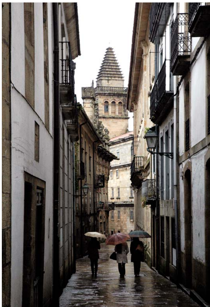
Rúa de Xelmírez