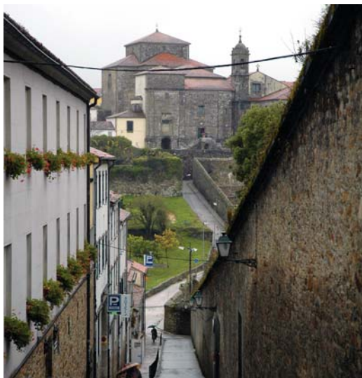
Rúa das Trompas

couselos, de folla case circular, a herba da andoriña, que contén un leite amarelo utilizado para eliminar verrugas, os alfinetes vermellos, as pequenas flores azul-violeta dos paxariños. Paredes nas que pousan os paxaros, como o rabirrubio, tan abundante en Belvís. Neste parque podemos demorarnos na observación de paxaros, árbores, pedras, antes de tomar pola rúa das Trompas en dirección ao que noutro tempo foi o intramuros.