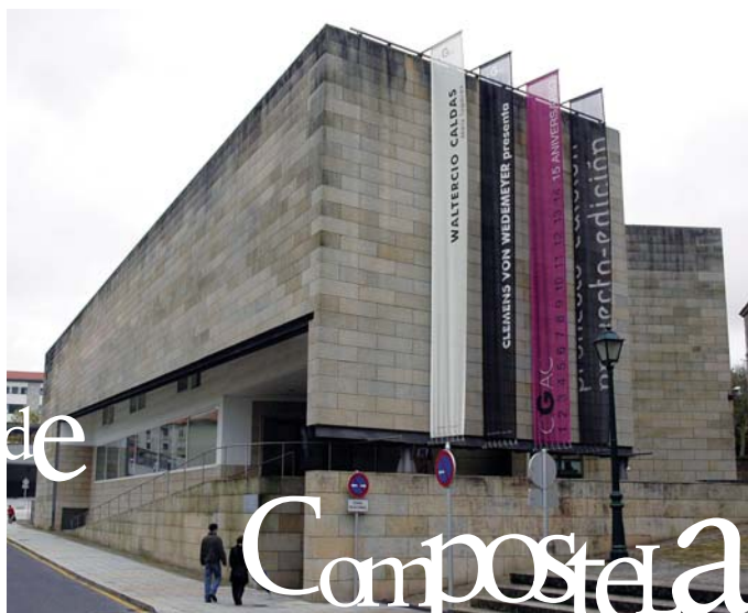
Centro Galego de Arte Contemporánea

auga e esculturas, ao cumio do parque. A cidade histórica esténdese aos nosos pés, espreguizando as innumerábeis torres en competencia coas da catedral, lavando na chuvia a pel dos seus tellados (deséxovos que contempledes os tellados de Santiago nun día de sol, mais temos a estatística en contra), erguendo as chemineas que xa non cospen fume. Observando as chemineas máis