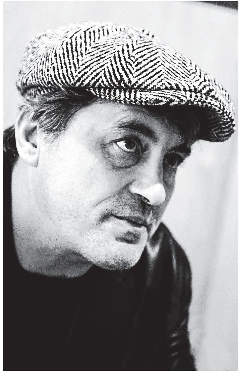
O poeta e narrador coruñés Manuel Rivas

Toda a escrita deste autor constitúese, en fin, como un sistema poliédrico con argumentos que poden ser activados ou desactivados