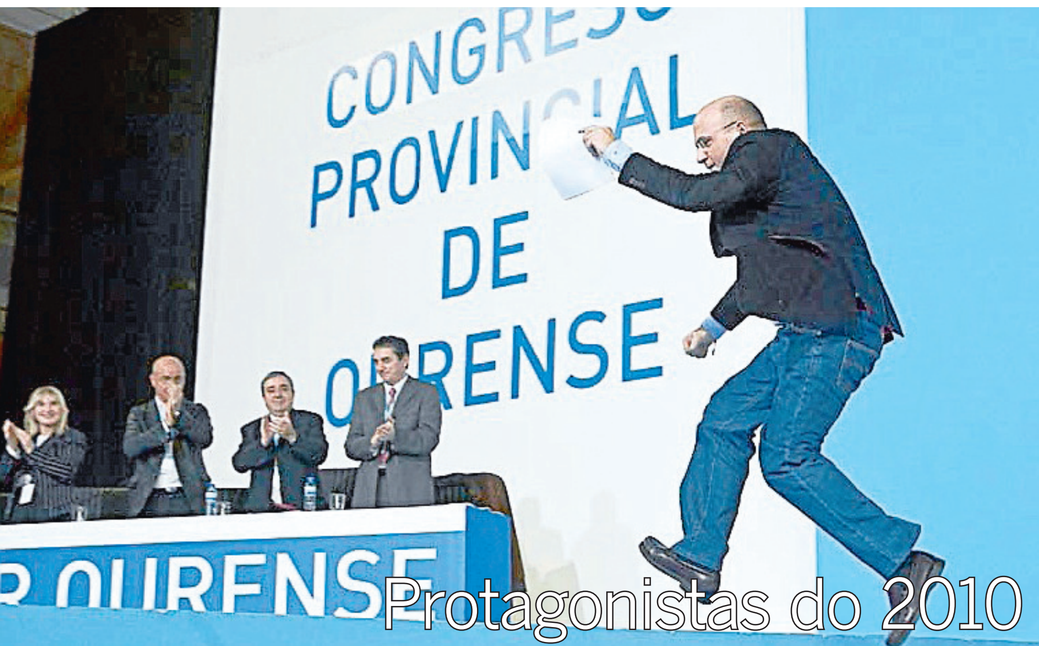
Protagonistas do 2010