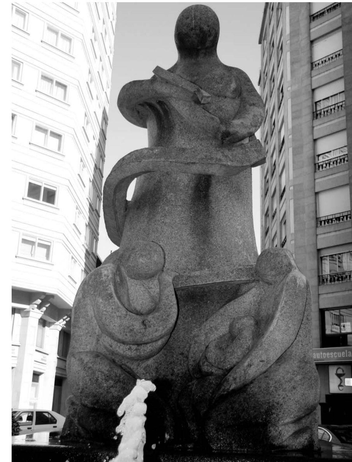
Estatua de Rosalía de Castro en Vigo, na avenida que leva o nome da autora

O desexo de ocultar todo o que nela resultaba incorrecto e a necesidade que a propia Rosalía tivo en vida de ocultar o lado máis político da súa actividade para evitar o rexeitamento social, fan que algunhas partes do seu pasado sexan borrosas, e explica que a día de hoxe