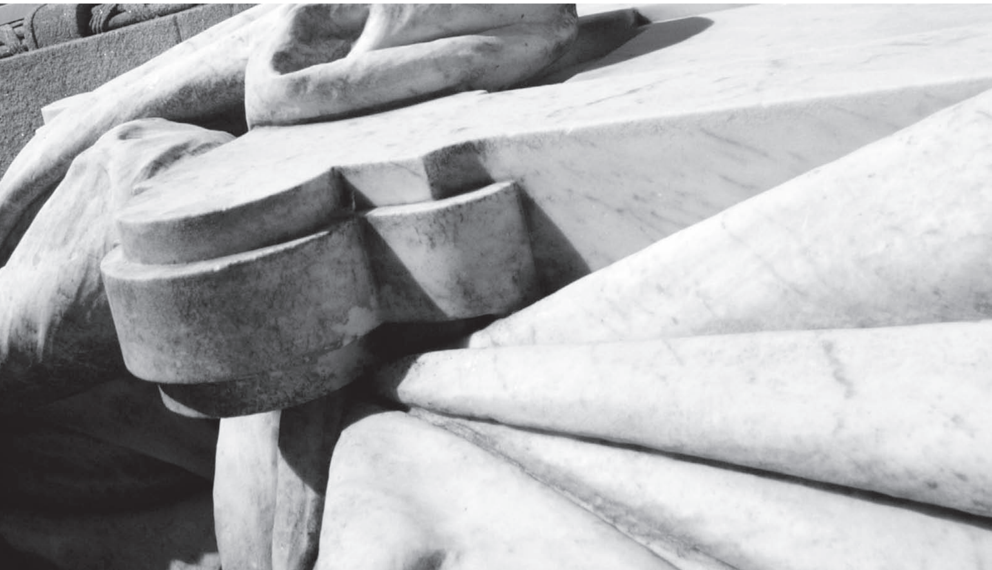
A estatua de Rosalía de Castro situada no Paseo da Ferradura, na Alameda de Santiago, inaugurada en 1917 polo Estado

XABIER CORDAL: “DENTRO DO PATRIARCADO, HOUBO QUEN NON SOUBO LELA E QUEN NON QUIXO”